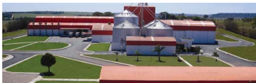
Foto da fábrica da PremieR pet em Dourado, 2010.

Em 1995 nasceu a PremieR pet com a missão de promover saúde, bem estar e qualidade de vida para os cães e gatos, oferecendo o que há de melhor em alimentos para animais de companhia.