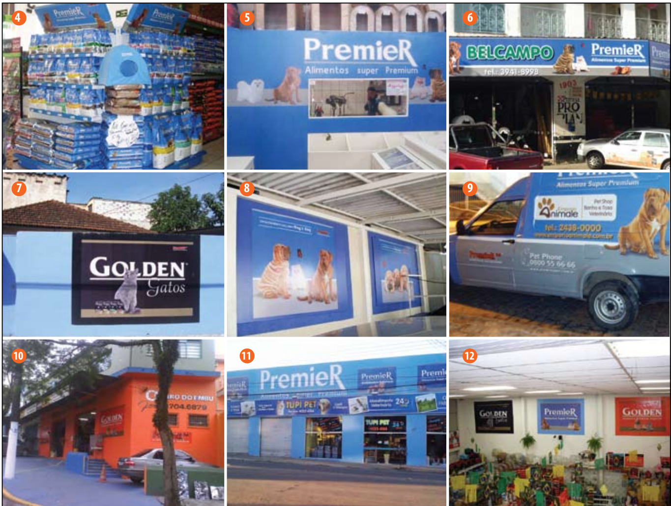
1 Fattori - Brasil Camp