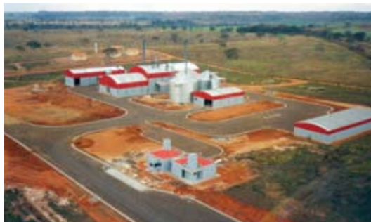
Foto aérea da fábrica da PremieR pet em Dourado, 1995

“Com a simplicidade de suas emoções eles nos conquistam. Abanam a cauda de alegria com o nosso afago, ou quando os levamos a um passeio. Quando retornamos ao nosso lar somos recebidos com pulos, latidos ou miados saudosos de nossa companhia. Na verdade, o que nossos cães e gatos mais querem é uma retribuição do que mais sabem dar: carinho, e uma das melhores formas de retribuir esse carinho é lhes proporcionando o que há de melhor em nutrição.”