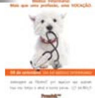
Revista MedVet; Edição Setembro