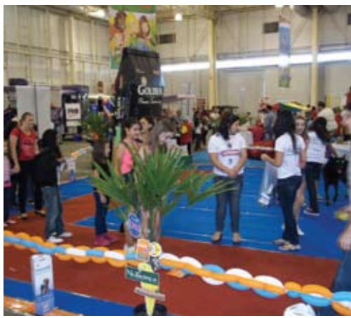
Evento "Dia das Crianças", realizado em parceria com a loja Amazon pet - Joinville