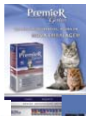
Revista Pulo do Gato, Revista Clínica Veterinária e Jornal Mundo Pet; Edição Jul - Dez