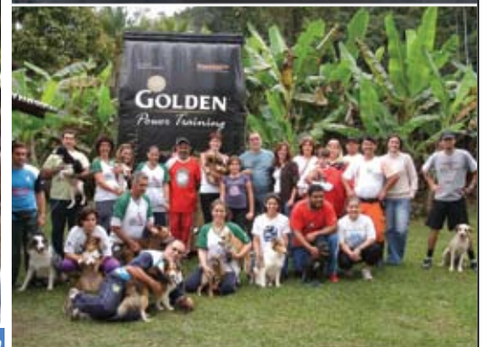
Agility em Raiz da Serra - RJ