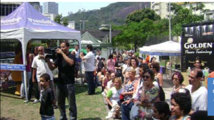
Evento realizado em parceria com a loja Argus Pet Fashion - RJ