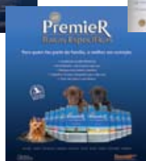
Jornal Estado de São Paulo; Edição Agosto