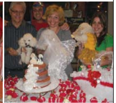
Encontro de Poodle - RJ