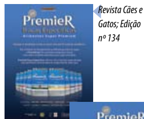
Revista Cães e Gatos; Edição nº 134

através de anúncios em revistas, jornais, sites e blogs. Confira algumas publicações.