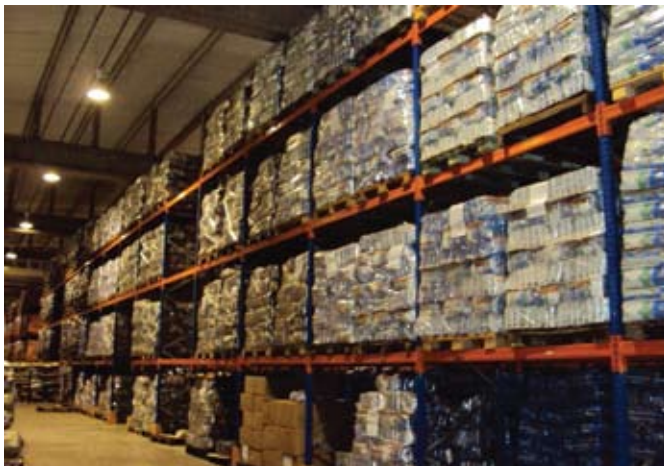
Estoque linha Super Premium - Fábrica PremieR pet