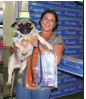
Encontro de cães da raça pug – PUGNICK - realizado em parceria com a loja Aquário Pet - RJ