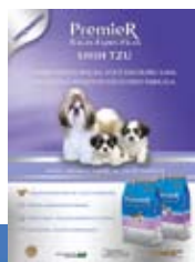
Revista Pequenos Cães e Clínica Veterinária; Edição Nov/Dez