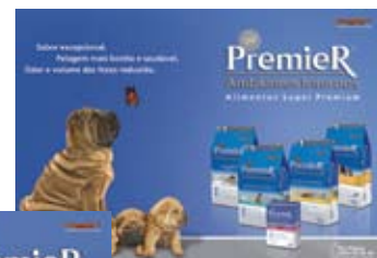
Revista PetMag; Edição nº 01