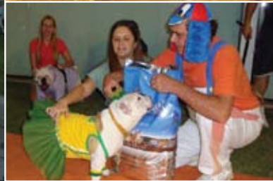
Encontro de bulldogs, realizado em parceria com a loja Aquário Pet - RJ