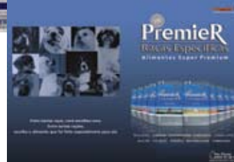
Jornal Estado de São Paulo; Edição Agosto