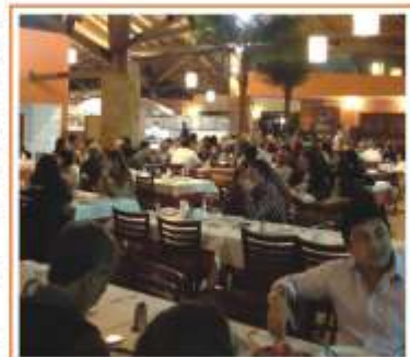
Jantar com os Criadores